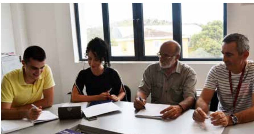
Sa jednog od sastanaka predstavnika EPCG i kompanije "Knjaz"

U toku je druga faza na sređivanju arhivske i registratorske građe u EPCG. Kroz tendersku procedure a shodno odluci Državnog arhiva Crne Gore izvršeno je izlučivanje i uništenje bezvrijednog registratorskog materijala, a ovaj posao je povjeren firmi D.O.O. "Monte EKO RECIKLAŽA" iz Nikšića. Izlučeno je 310 m dužnih bezvrijedne registratorske građe odnosno ekvivalent oko 7 tona, a u građi je prisutna dokumentacija stara i preko 40 godina.