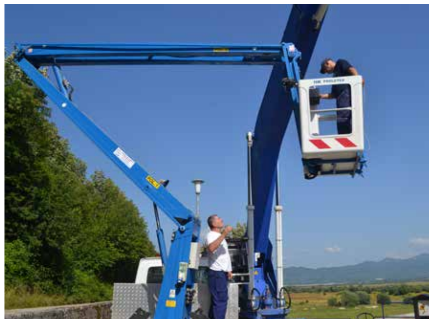
Detalj sa ovogodišnjeg remonta

Remontne aktivnosti se najvećim dijelom izvode na otvorenom prostoru, pa posao u velikoj mjeri zavisi od vremenskih uslova. Uposleni se suočavaju sa raznim teškoćama, kao što su kiša, visoke dnevne temperature, neprijatni mirisi sa deponije, koja je u blizini, ali svojim profesionalnim i stručnim djelovanjem uspijevaju da se izbore sa svim eventualnim smetnjama.