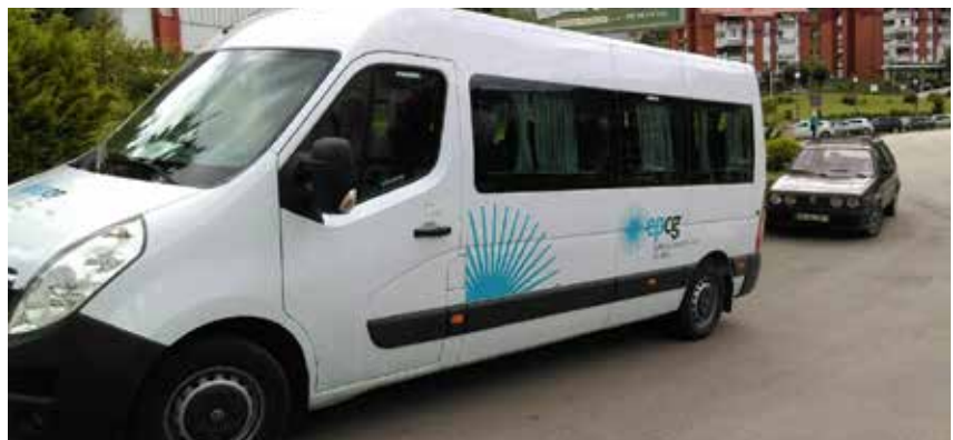
Jedan od novih minibusova za prevoz zaposlenih

Početkom 2017.godine u EPCG AD Nikšić počeo je da se primjenjuje novi Pravilnik o organizaciji i sistematizaciji radnih mjesta. U okviru Direkcije za IMS i opšte poslove tada je formiran Sektor za saobraćaj transport i mehanizaciju, kao centralizovana cjelina na nivou EPCG.