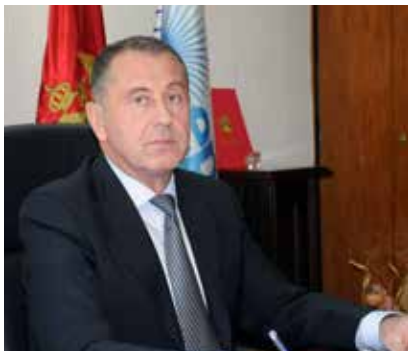
PREDSJEDNIK OD EPCG - ĐOKO KRIVOKAPIĆ

Inicijativa za objedinjavanje termoenergetskog kompleksa u Pljevljima datira još od kraja prošlog vijeka zato smatramo da smo konačno ispravili višedecenijsko kašnjenje i da se u skladu s trendovima i dešavanjima u energetske industriji usmjerimo prema povećanju nivoa vertikalne integriranosti ova naša dva segmenta proizvodnje. Naime, svi rudnici uglja u regionu posluju u sastavu termoelektrana ili kao dio mješovitih društava, a u principu se radi o kapacitetima sličnog obima kao TE „Pljevlja“ i RUP.