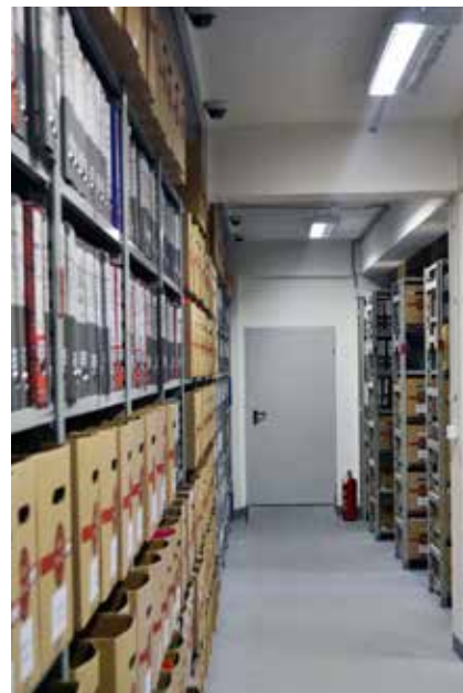
Sigurnost građe na prvom mjestu