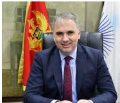
IZVRŠNI DIREKTOR EPCG, IGOR NOVELJIĆ

Podsjeticu da su sve analize koje je smo sproveli ukazale da stvaranje sinergija u proizvodnji uglja i električne energije i smanjenje operativnih troškova sistema RUP-TEP što dovođi i do smanjenja proizvodne cijene električne energije, predstavlja bitan preduslov još boljeg poslovanja kompanije na slobodnom tržištu i bolje konkurentnosti pljevaljskog energetskog kompleksa.