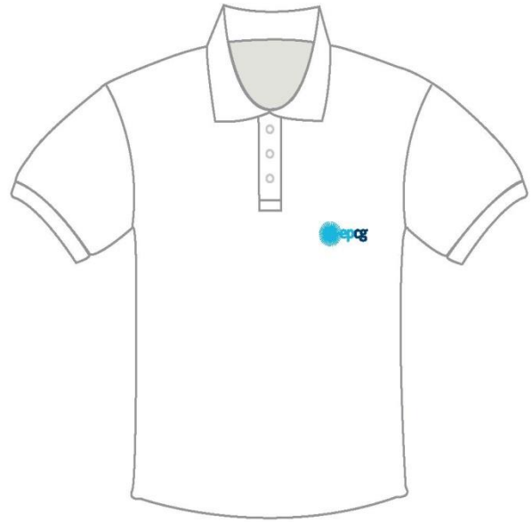
Opis br. 5: Boje znaka i logotipa u skladu sa KGS