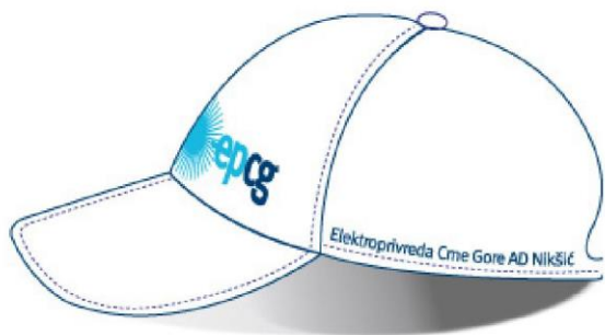
Opis br. 6: Boje znaka i logotipa u skladu sa KGS